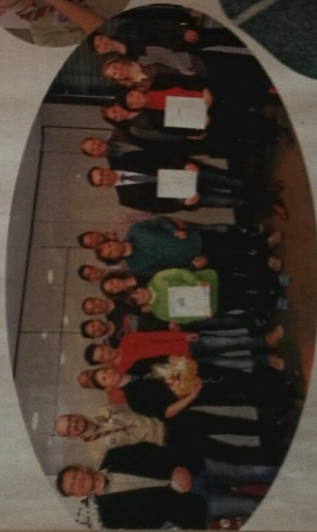
Über Preise freuen konnten sich die Klimpanzen, die Jugendfarm Schwarzbach und WIK – Wir im Kiez – Projekt der deutschen röhren Kreuzel in Berlin.